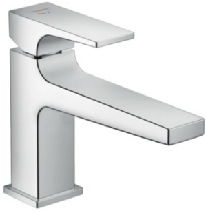
WT Armatur Hansgrohe Metropol Einhebel WT Mischer