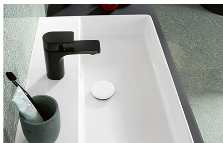
Waschtische: Vileroy&Boch Memento 2.