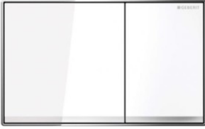
Geberit Betätigungsplatte Sigma 60 flächenbündig Glas Weiß