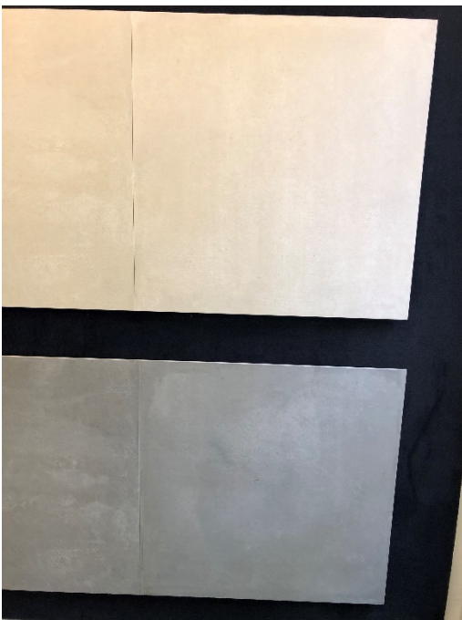
Wand- und Bodenfliesen: l'argilla Station Brown für den Boden und Sand für die Wand