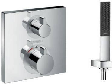
Armatur Wannen und Duschen: Hansgrohe EcostatSquare Hansgrohe Rainfinity Stabhandbrause