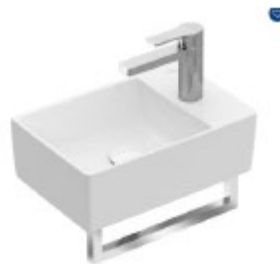
Hanwaschbecken WC : Villeroy&Boch Memento 2.0 Armaturen ident WT Anlage im Bad