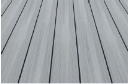
WPC Fano Ultrashield – silbergrau