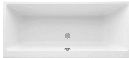
Badewanne Villeroy&Boch Subway Acryl 180/80