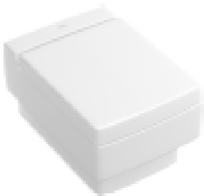
WC Villeroy&Boch Memento