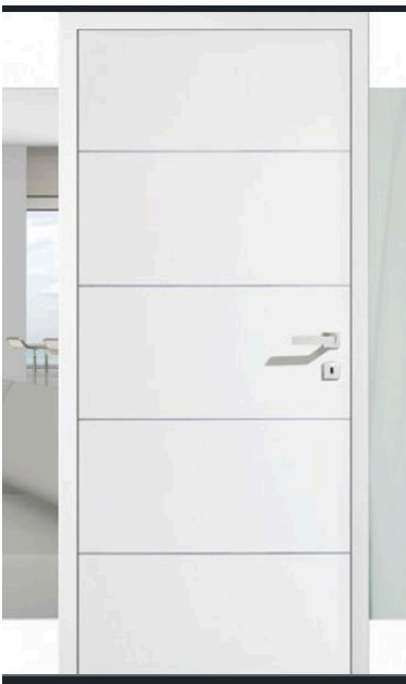
Modell Kunex Studio 04 mit verdeckt liegenden Bändern