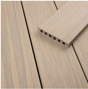
WPC Fano Ultrashield – Antik gebürstet