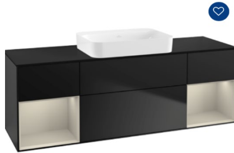
WT Unterbauschrank nach Serie Villeroy&Boch Fineon