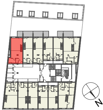
Lageplan 1. Obergeschoss