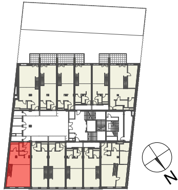
Lageplan 3. Obergeschoss