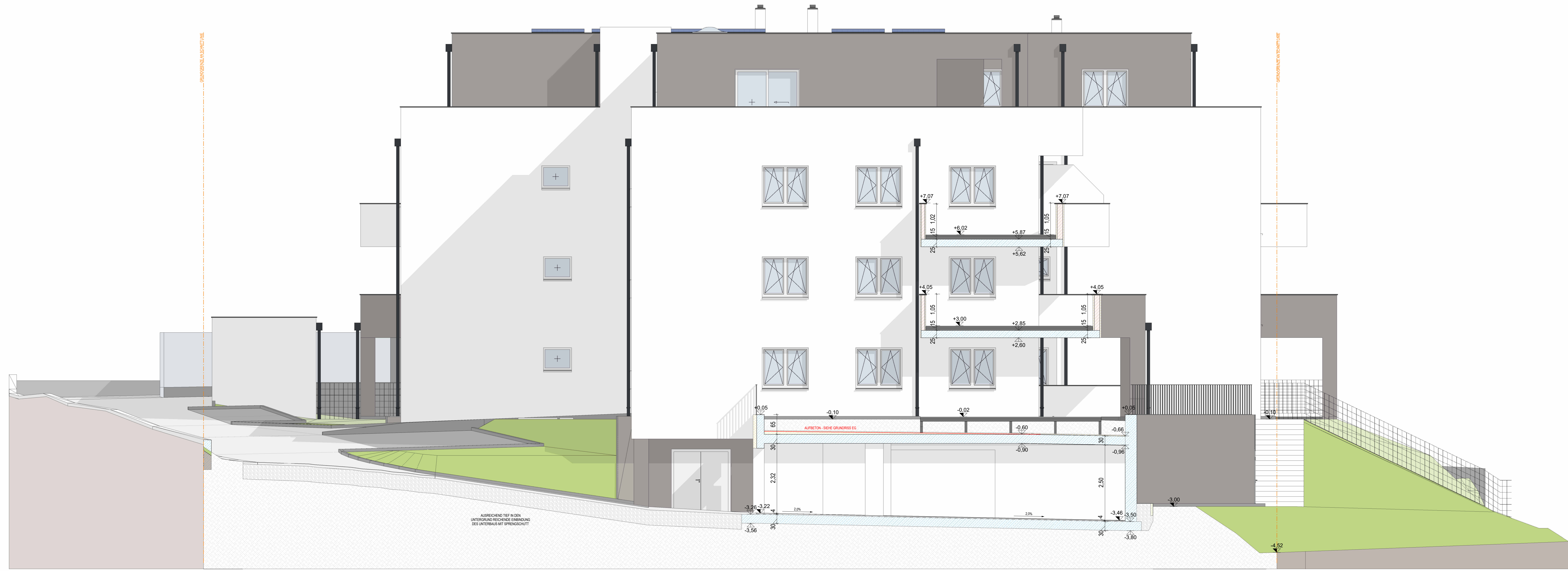
SCHNITT F-F M 1:50