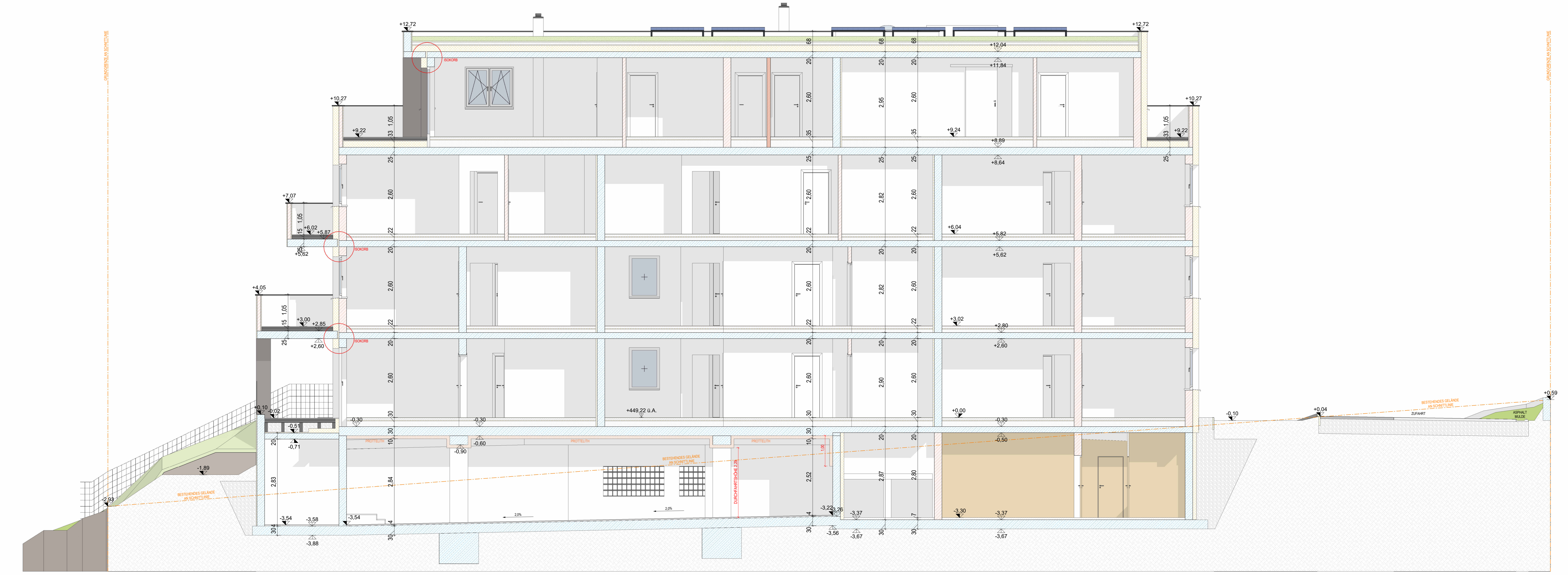
SNITT B-B M 1:50