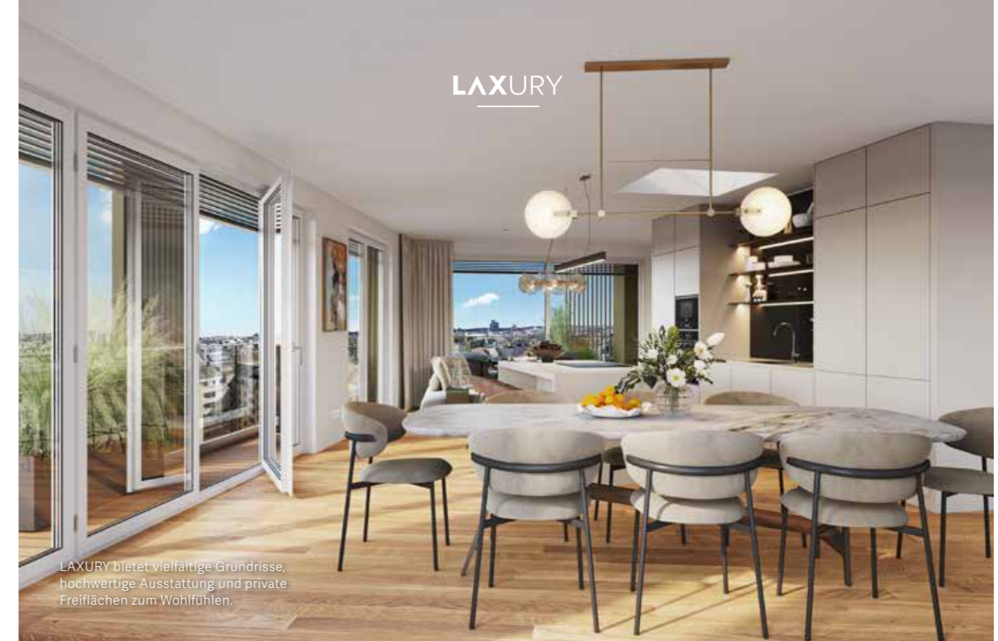
LAXURY bietet vielfältige Grundrisse, hochwertige Ausstattung und private Freiflächen zum Wohlfühlen.