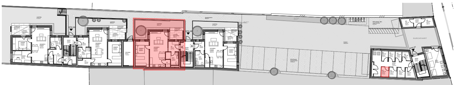
ÜBERSICHTSPLAN ERDGESCHOSS M 1:500