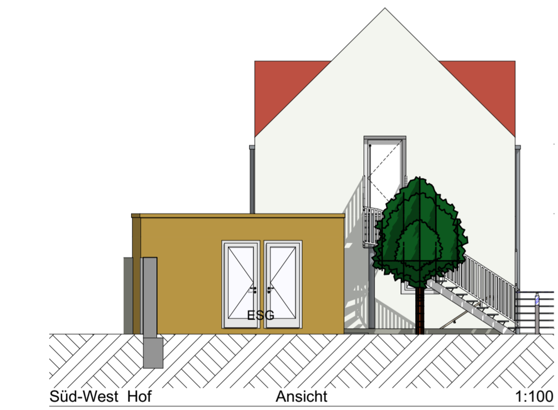
Süd-West Hof Ansicht 1:100