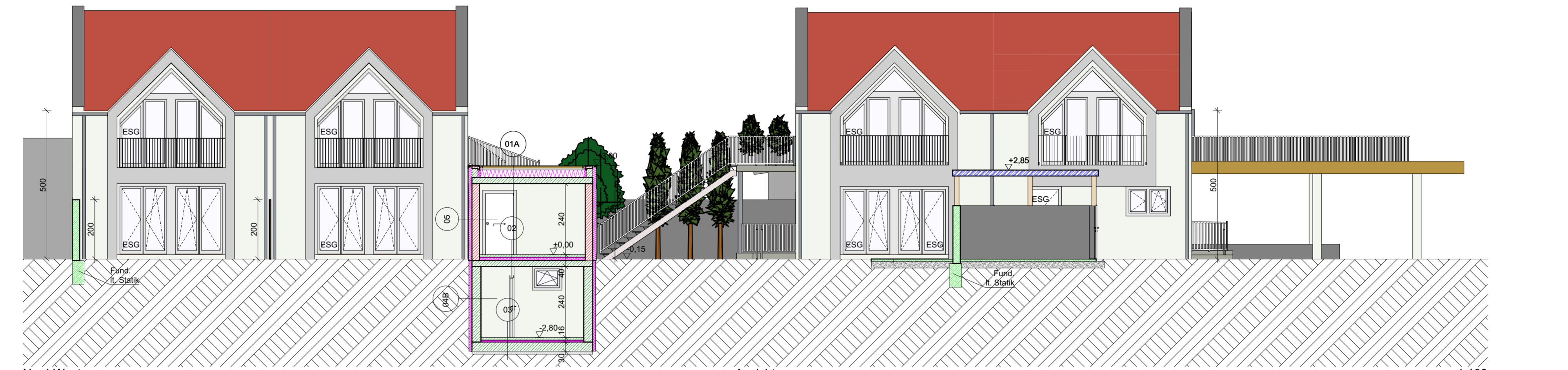
Nord-West Ansicht 1:100