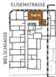
GRUNDRISS (1. OG)